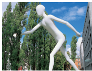
2 Munich Re West 5 Leopoldstraße 36, 80802 München

Fahren Sie auf der Leopoldstraße und biegen in die Martiusstraße ein. Sie folgen der Straße über die Thiemestraße und biegen rechts in die Königinstraße ein.