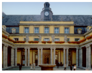
1 Munich Re Hauptgebäude Königinstraße 107, 80802 München