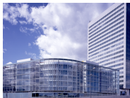
3 Munich Re Nord 2 und Nord 3 Am Münchner Tor 1, 80805 München

Fahren Sie auf der Leopoldstraße bis zum „Walking Man“.