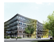
5 Munich Re Nord 6 Berliner Straße 95, 80805 München

Fahren Sie auf der Leopoldstraße und biegen in die Martiusstraße ein. Sie folgen der Straße über die Thiemestraße und biegen links in die Königinstraße ein. Am Ende der Königinstraße biegen Sie halbrechts in die Mandlstraße.