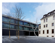
4 Munich Re Nord 4 Mandlstraße 3, 80802 München